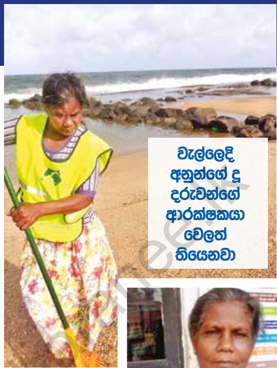
වැල්ලෙදී අහුන්ගේ දු දරුවන්ගේ ආරක්ෂකයා වෙලෙන් තියෙනවා

කවර දන්න ඕන කරන වුවන් පේපර කොළයි, ඉටි කොළයි ගන්න. මගේ පුතා වගේම දුවයි, දුවගේ දරුවොයි ඉන්නේ මං ළම. මොන අඩපාඩු තිබුණත් දරුවන්ගේ ඉගෙනීම ගැන තමයි මගේ හිතේ තියෙන්නේ. එදත් ගෙදර අඩුපාඩු තිබුණා. ඒ වෙලාවේ මම දැක්කා පල්ලිය ළම බඩු බැන් බෙදුවා. ඒ මනුසත් දෙරණින්. මටත් බඩු බැන් එක්ක ලැබුණා. ඒ වෙලාවේ මම දෙරණේ මගේ මහත්තයට මගේ කරත්ත අවශ්‍යතාවය ගැන කිව්වා. ඊටපස්සේ ඊට යන මුදල ලබාදෙන්න කැමති වුණා. මට කිව්වා සමුද්‍රය පරිසර