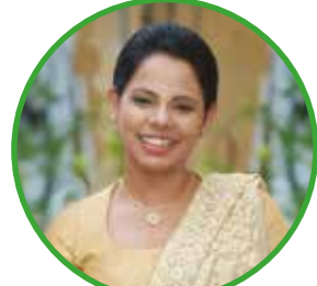
ශාකමලි පතිරගේ මාතෘ සහ ළමා සෞඛ්‍යය උපදේශිකා අනුග්‍රහය : ස්වදේශී කොහොඹ බේබි

කොහොඹ ශාකසාර ගුණයෙන් අනුන ස්වදේශී කොහොඹ බේබි සබන්, ක්‍රීම්, කොලෝන්, පුයර, ඔයිල් සහ ඇමිපු ශාකසාර ළදරු නිෂ්පාදන පෙල ඔබේ බිලිදුගේ සම විෂබීජ වලින් ආරක්ෂා කරන අතර සම පෝෂණය කරමින් සමේ තෙතමනය සුරකීමත් සමට සුමුදු සුවදැනි සුවදෙයි.