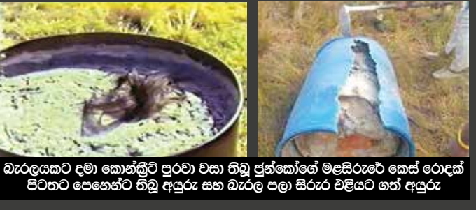
බැරලයකට දමා කොන්ක්‍රීට් පුරවා වසා තිබූ ජුන්කෝගේ මළසිරුරේ කෙස් රොදක් පිටතට පෙනෙන්නට තිබූ අයුරු සහ බැරල පමා සිරුර වලියට ගත් අයුරු

වැඩිම වදනිංසාවන්ට ලක්වී මියගිය තරුණිය ලෙසයි. එහි බරපතලකම කොතෙක්ද කිවහොත් ඊට අදාළ නඩුව උසාවියේදී විභාග කෙරුණ අවස්ථාවේ උසාවි බිමේ සිටි බොහෝ කාන්තාවන් කම්පනය වී සිහිතැනිව බිම ඇද වැටුණි. ඒ අතර ඇගේ මවද විය.