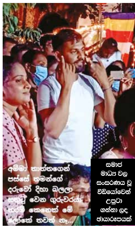
අම්මා තාත්තගෙන් පස්සේ ඉමන්නගේ දරුවෝ දිනා බලලා සතුටු වෙන ගුරුවරයා ගැන කෙනෙක් මේ ආකාරයේ තවත් නැති නොවේ.

ඒ හඬ නර්තන ගුරු දැමීන් නිලංගයෝය. එසේ කීවාට මේ ගුරුතුමා කවුදැයි කියන්නට කවුරුත් මීට පෙර දැනසිටියේ නැත. එහෙත් පසුගියද සමාජ මාධ්‍ය තුළ සැරසෙමින් පවතින විවිධයෝව මේ වනවිට ලක්ෂ සංඛ්‍යාත පිරිසක් නරඹා ඇති හෙයින්, මේ කියන ගුරුතුමා ගැන මතකයට නගාගැනීමට අසීරු නොවේ.