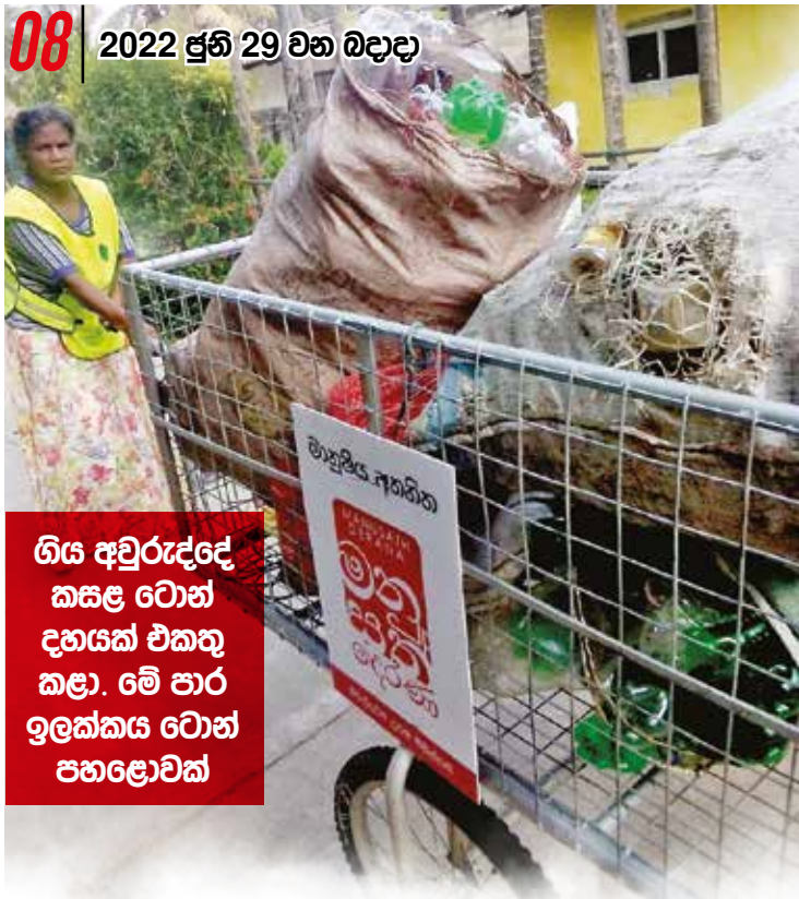
ගිය අවුරුද්දේ කසළ ටොන් දහයක් එකතු කළා. මේ පාර ඉලක්කය ටොන් පහළොවක්