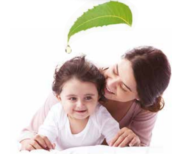
දරුවාට සනීපාරක්ෂක නිෂ්පාදන තෝරා ගැනීමේදී, මෘදු, සුමුදු, ස්වභාවික ශාකසාර අඩංගුව නිෂ්පාදනයක් තෝරා ගැනීම ඉතා වැදගත්.

සමට සිසිලය ගෙනදෙන බේබි සබන් වලින් බිලිදු සම සුමුදුව පිරිසිදු කර බේබි ක්ලෝන්, බේබි ක්‍රීම් ආලේප කර දරුවාට සුවපහසු නින්දක් ලබාදෙන්න.