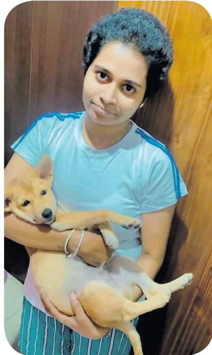
දෙන්නටම අවුරුදු විසිපහයි."

ඒ කොරෝනාව හිස ඔසවා දරුණු ලෙස පැතිරගිය කාලයයි. නිරෝධායන ඇඳිරිනීතිය නිසා සුරංජීත්ගේ රැකියා ස්ථානයෙන් වැඩ නැති වුණේය. අතමිට මුදල්ද හිඟ වූ ඒ කාලයේ හදිසියේම වරන්දි තුළ ඇතිවූ රෝග ලක්ෂණයක් පරීක්ෂා කිරීමෙන් අනතුරුව ඔවුන් දෙදෙනාටම අසන්නට ලැබුණේ ජීවිතේ කවදාවත් අසන්නට බලාපොරොත්තු නොවූ දෙයකි. ඒ වරන්දි ගැබ්ගෙළ පිළිකාවකට ගොදුරු වී ඇති බවත්, එය විශාල ලෙස පැතිරී ඇති නිසා මහරගම අපේක්ෂා රෝහලින් ඊට ප්‍රතිකාර කළ යුතු බවත්ය.