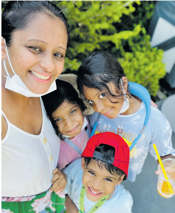
එයාලගෙ ඇසුරෙන්ම තමයි ගොඩක් වෙලාවට අපේ වැරදි ගැන අපිට

ඒක දරුවෝ ආස කෑම උයලා දෙන එකට වඩා, ලස්සනට කෑම පෙට්ටිය හදනවාට වඩා එහා ගිය ලොකු කැපකිරීමක්. තමන්ගේ දරුවන්ට හොඳම අම්මා වෙන්න උත්සාහ කරද්දී අපිට සිද්ධ වෙනවා බොහෝම නිතරමානිව අපේ වැරදි පිළිඅරගෙන ඒවා නිවැරදි කරගන්න. ඉතින් මම තමයි අම්මා, මගේ අතින් වැරදි වෙන්නේ නෑ කියලා හිතන්නේ නැතුව, මමතම මගේ අඩුපාඩු දවස ගානේ හදගන්නවා. දරුවොත් එක්ක ඉන්නකොට