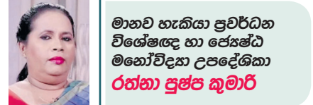
මානව හැකියා ප්‍රවර්ධන විශේෂඥා හා ජ්‍යෙෂ්ඨ මනෝවිද්‍යා උපදේශක රත්නා ප්‍රසාද කුමාරි

පස්සේ නයෝමි සමන්තගෙන් උදව් ඇතිව ලියුම් කවර අලවන්න පටන්ගත්තා. ඒ වගේම එයින් ඇයට සැලකිය යුතු මුදලක් ලැබෙන බවත් පස්සේ ඇය මාත් එක්ක කිව්වා. ඉතින් අසල්වැසි ගෙවල්වලට යන්න හුරුවෙව්වී කාන්තාවක් නම් මෙව්වකල් අහල පහල ගෙවල්වල ගෘහ උදව්ව එක්ක එකතු වෙලා අනුන්ගේ ඕපදුප කියවෙවා නම් ඒ කාලයෙන් සුළුවට හරි ස්වයං රැකියාවක් පටන්ගන්න. පුළුවන්නම් ඒ වැඩේට ඒ අයවත් එක්කාසු කරගන්න. මේ වගේ අමාරු කාලෙක ගෙදර ආර්ථිකේ සරි කරගන්න සැමියාට හයිසක් වෙන්න පුළුවන් නම් ඒක තමයි මේ වෙලාවේ බිරිඳකට කරන්න පුළුවන් ලොකුම දේ.