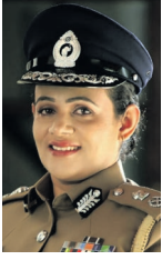
ළමා හා කාන්තා කාර්යාංශයේ විමර්ශන භාර නියෝජ්‍ය පොලිස්පතිනි රේණුකා ජයසුන්දර

කොළඹ ඇතුළු ප්‍රධාන නගර රැසකම පාරේ, පොදු ස්ථානවල, ආලෝක සංඥා පුවරු අසල මෙන්ම පුජනීය ස්ථාන අසලද වැඩි වශයෙන් යාවකයින් දක්නට ලැබීම අරුමයක් නොවේ. ඉන් වැඩි පිරිසක් සිඟමන් යදින් හෝ අතදරුවන් හෝ පාසල් යන වයසේ බාලවයස්කාර දරුවන්ද සමඟිනි. එලෙස සිඟමන් යොදවන බාලවයස්කාර දරුවන් නිවැරදිව කිරීමට මත්ද්‍රව්‍ය ලබාදෙන බවට ළමා හා කාන්තා අපයෝජන නිවාරණ කාර්යාංශයට පසුගිය දිනක ඔක්තෝබර් මාසයේදී ප්‍රධාන පොලිස් පරීක්ෂක ඉනෝකා ඇතුළු පිරිස සෙසු නිලධාරීන්ද සමඟින් කිරුළපන පොලිසියට එක්වූයේ එම මෙහෙයුම් දියත් කිරීමටය. පසුව නියෝජ්‍ය පොලිස්පතිනි රේණුකා ජයසුන්දරගේ උපදෙස් පරිදි ප්‍රධාන පොලිස් පරීක්ෂකවරයන් වන සමන්ති සහ ඉනෝකාගේ මූලිකත්වයෙන් පොලිස් කණ්ඩායම් දෙකක් බේස්ලයින් පාර සහ කොළඹ කොටුව දෙසට බෙදී ගියහ. මෙම නිලධාරීන් මෙහෙයුමේ කටයුතු ඉතා සුක්ෂ්මව සහ රහසිගතව ක්‍රියාත්මක කළද පලපුරුදුකරුවන් වූ යාවක කාන්තාවන්ට මේ ගැන ඉව වැටීමට වැඩි වේලාවක් ගියේ නැත.