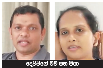
දෙවිමගේ මව සහ පියා

කියලා. අපි හිතුවා මෙයාට විශ්වාසයක් තියෙන නිසානේ මෙහෙම අහන්නේ කියලා. ඉතින් අපි කැමති වුණා. කියන්න සතුටයි පුතා උසස් පෙළත් ඉහළින්ම පාස්වුණා.”