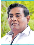
අන්තර්ජාතික වි. ජෝර්ජ්