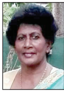
සීනා ජොන්නම්පෙරැම සවයං රැකියා පාඨමාලා උපදේශිකා