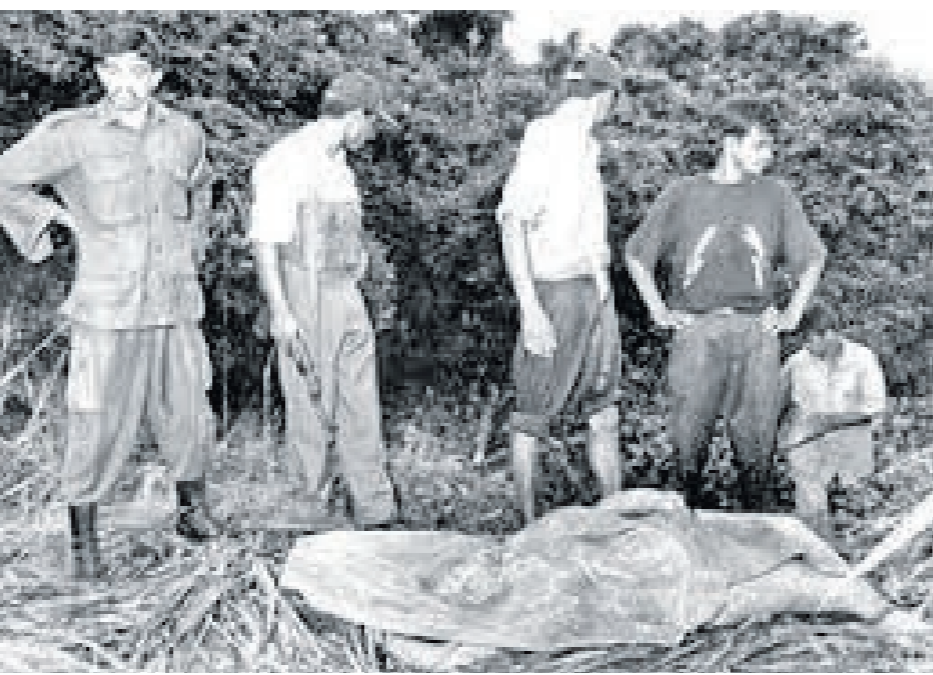
රටාගේ මළ සිරුර සොයා ගත් මොහොත

සෙසු තිදෙනාද තරමක් දුරස්ථ සිටියත් වාතාවරණය යහපත් නැති බව මනෝතරන් තේරුම්ගත්තේය. හෙතෙම මෙතැනින් පළා යන්නැයි රටාට කීවේය. ඒ උපදෙස පිලිගත් ඇ දුවන්නට වූවාය. එතෙත් පසුපස හඹා ගිය පළමු විත්තිකරු රටා රැගෙන ගිය දෙසට දිව ගියහ. පහරදීමට ලක්ව බිම වැටී සිට හැගීම් මනෝතරන්ට කළ යුතු කිසිවක් සිතා ගැනීමට නොහැකි විය. අවට කිසිවකුගෙන් උපකාර හිමි වූයේද නැත. හෙතෙම නිවසට දුව ගොස් උසස් පොලිස් නිලධාරියකු වූ සිය පියාට සිදුවීම දැනුම් දුන්නේය.