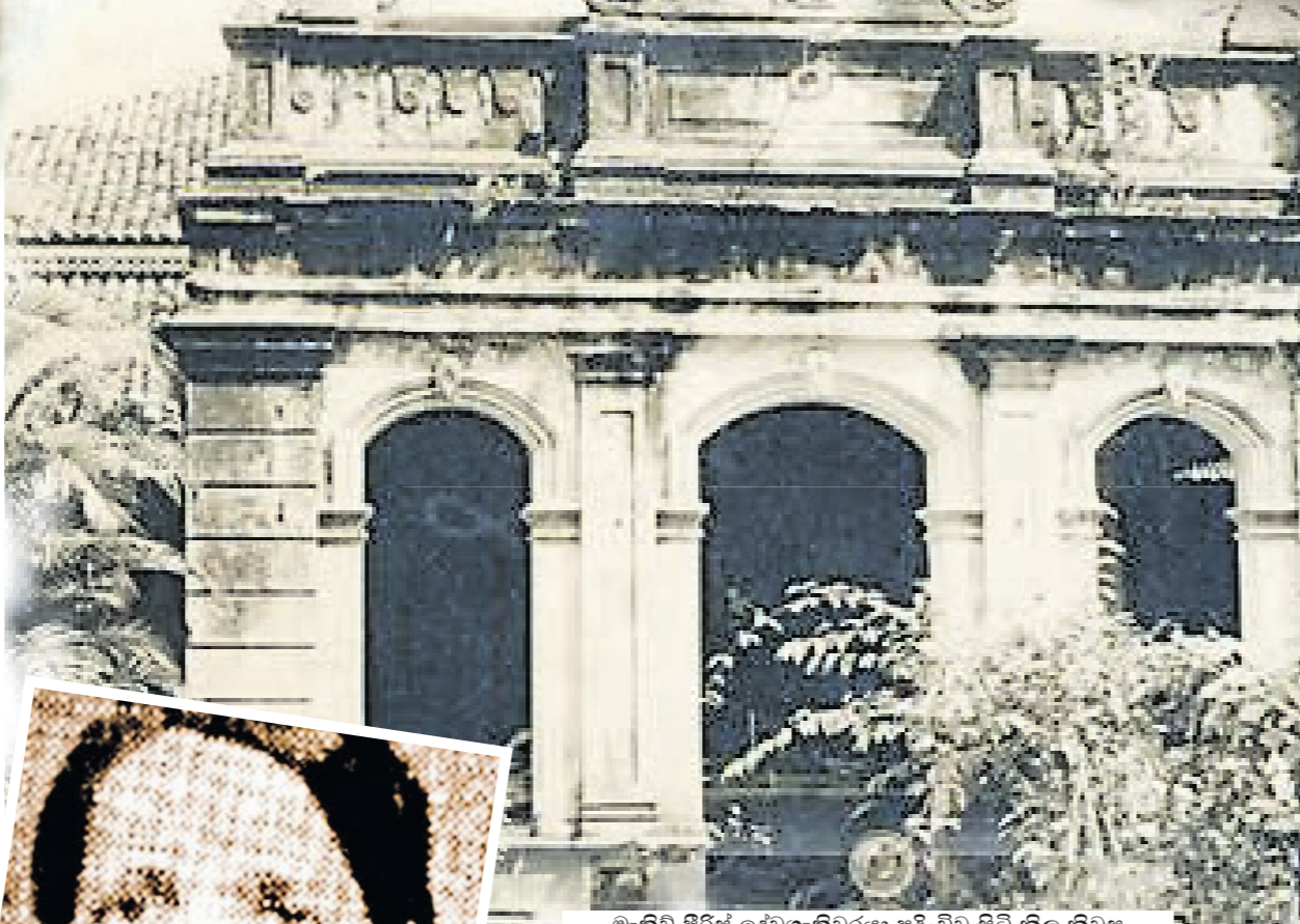
මැකිවී පිරිස් දේවගැතිවරයා පදිංචිව සිටි නිල නිවස