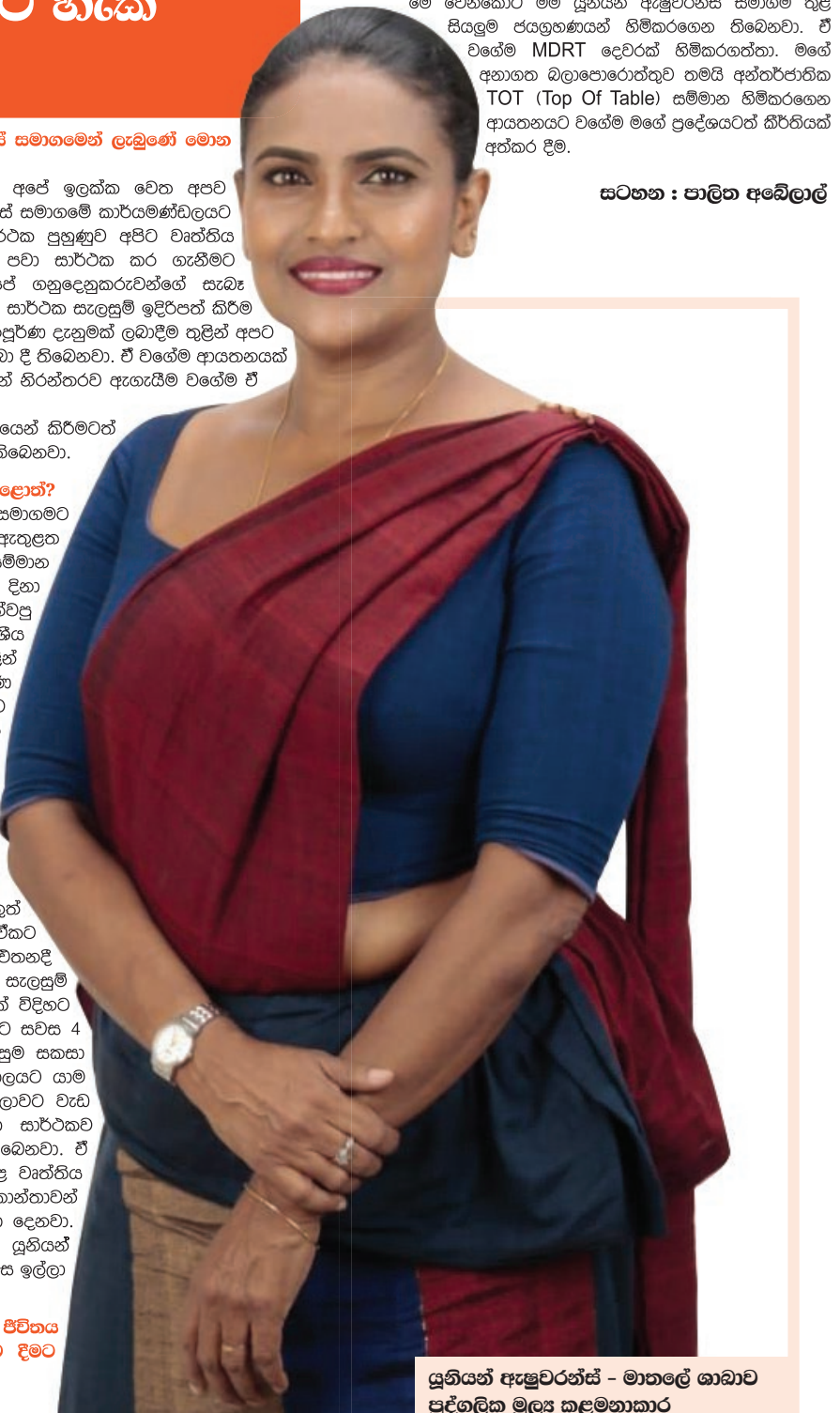
යුනියන් ඇප්ලවරන්ස් - මාතලේ ශාඛාව පුද්ගලික මූල්‍ය කළමනාකාර වම්පා සිරිවර්ධන