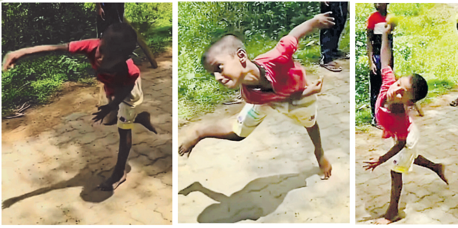
මුහුණු පොතේ පළ වූ විඩියෝවේ දරුවා පන්දු යවන ඉරියව්ව