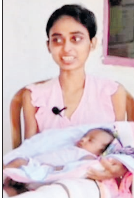
ශ්‍රියානි දරුවා සමඟ